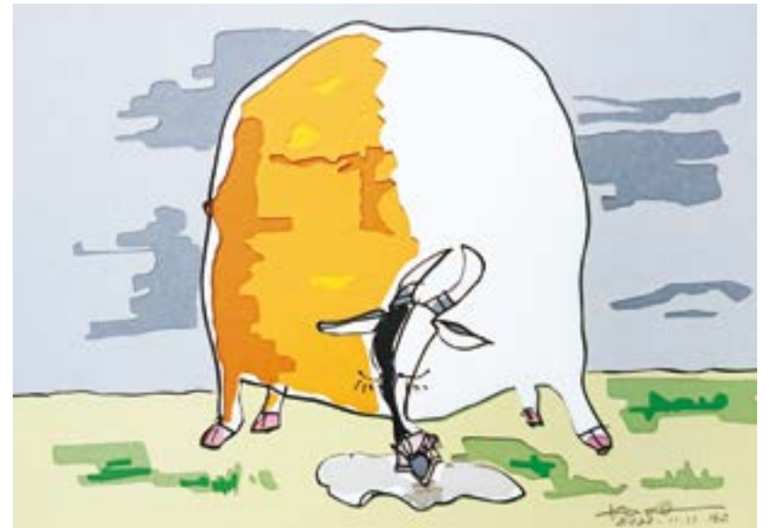
雨のち晴れ 210 mm × 297 mm