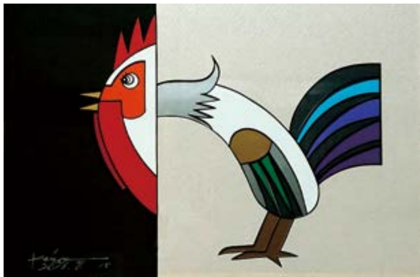
今、何時? 210 mm × 297 mm