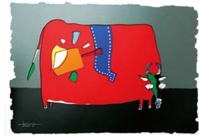
幸運の赤べこ 545 mm × 788 mm