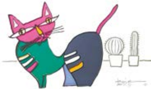
アリゾナを夢見て 210 mm × 297 mm