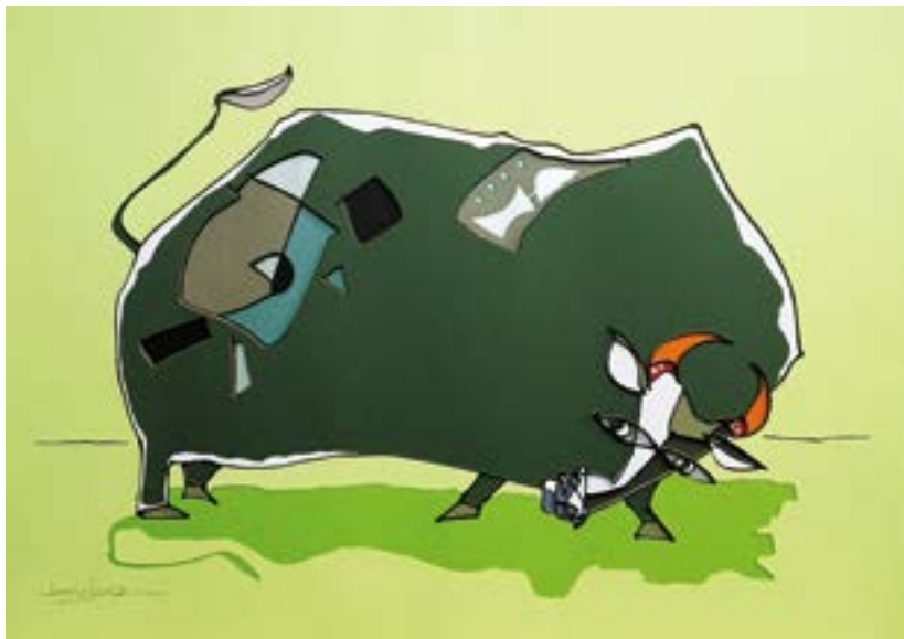
強き牡牛 297 mm × 420 mm