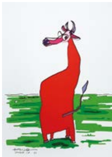
見返り美牛 297 mm× 210 mm