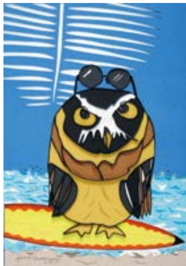
サーファー 297 mm × 210 mm