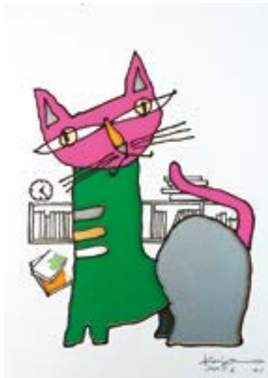
ミステリーがいっぱい 297 mm × 210 mm