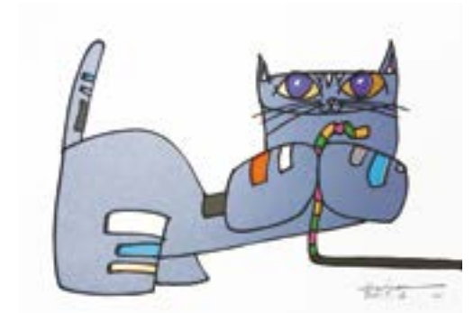
つかまえたーッ！ 210 mm × 297 mm