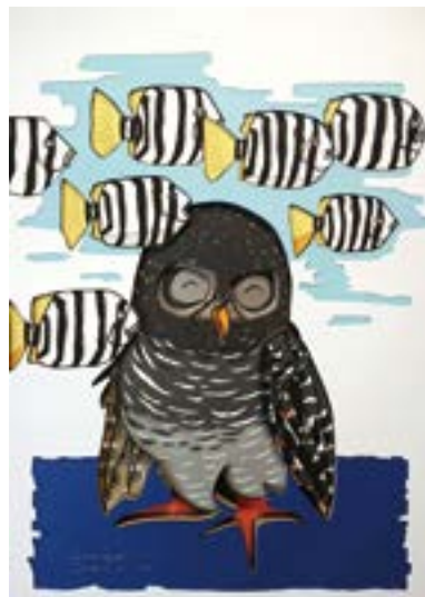
水族館のアカアシモリフクロウ 297 mm × 210 mm