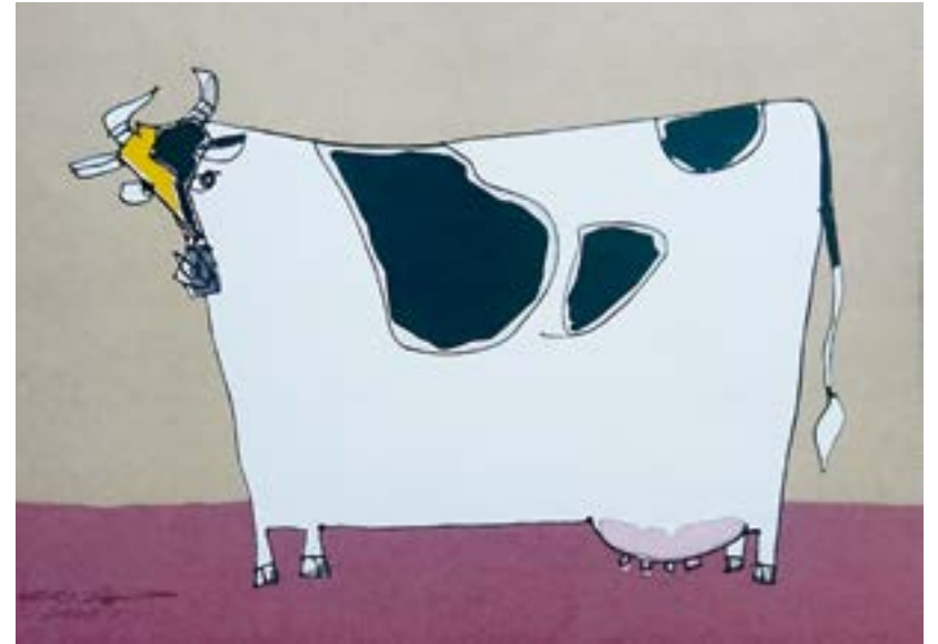
母になった日 210 mm × 297 mm