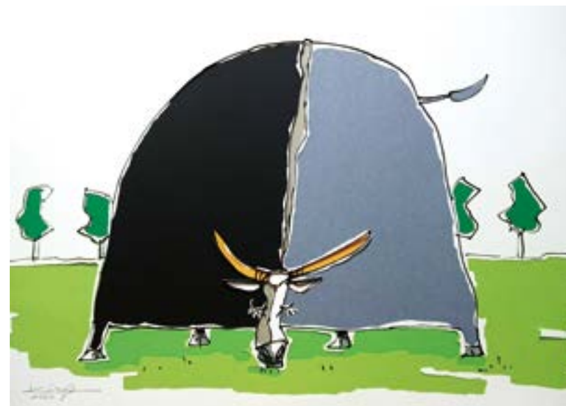
草を食む 394 mm × 545 mm