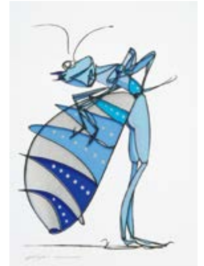
レビュー 297 mm × 210 mm