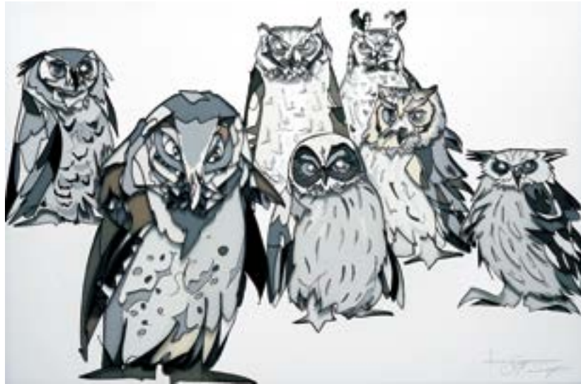
七人の侍 788 mm × 1091 mm