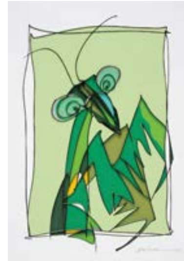
ゴーストの真似? 297 mm × 210 mm