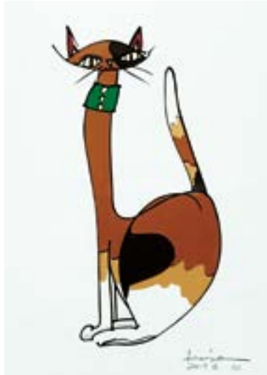
キャットウォークも見せたいワッ！ 297 mm × 210 mm