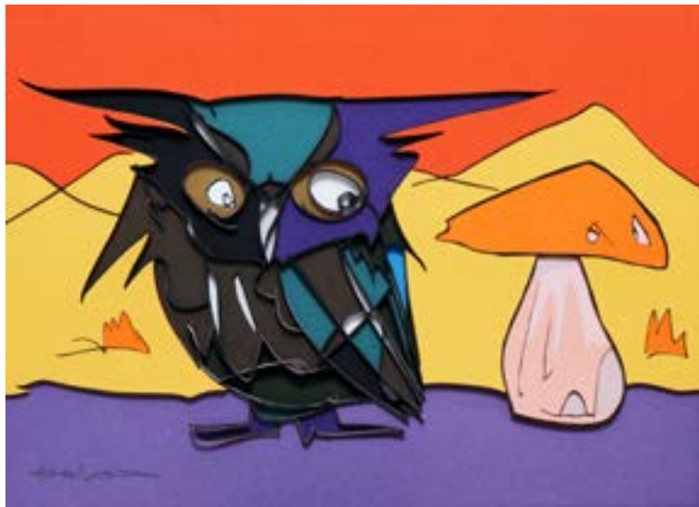
オレンジマジック