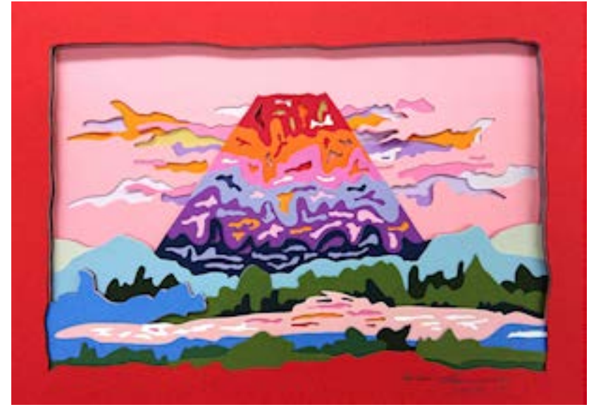
赤き霊峰 210 mm × 297 mm