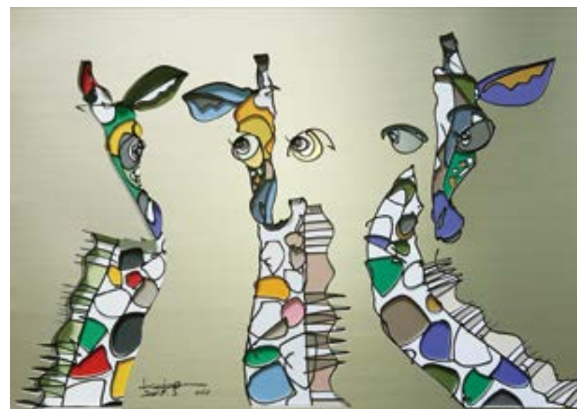
Mother Heart 297 mm× 420 mm