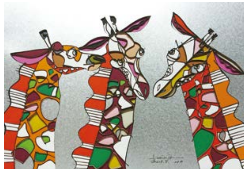
真実の行方 390 mm× 545 mm