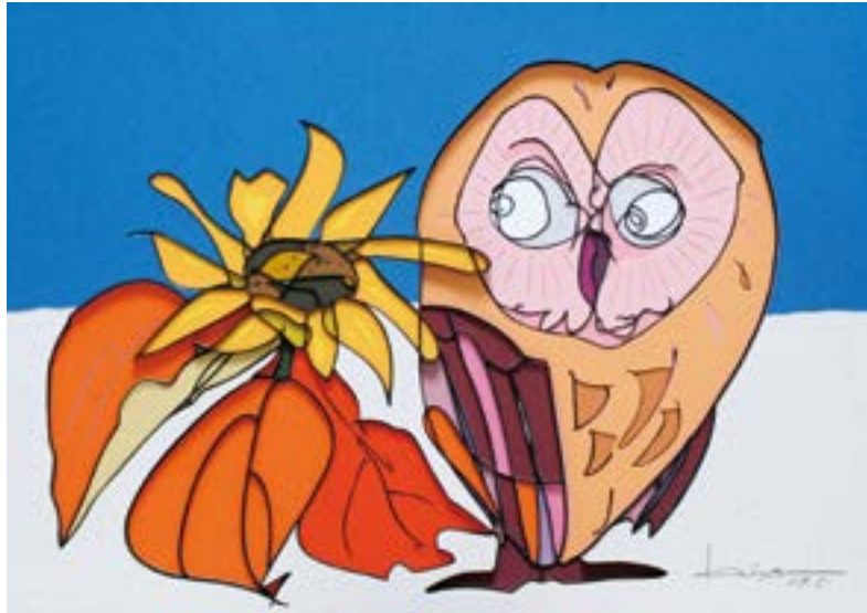
ひまわりとにらめっこ