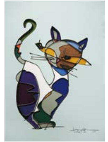
Come on, follow me !