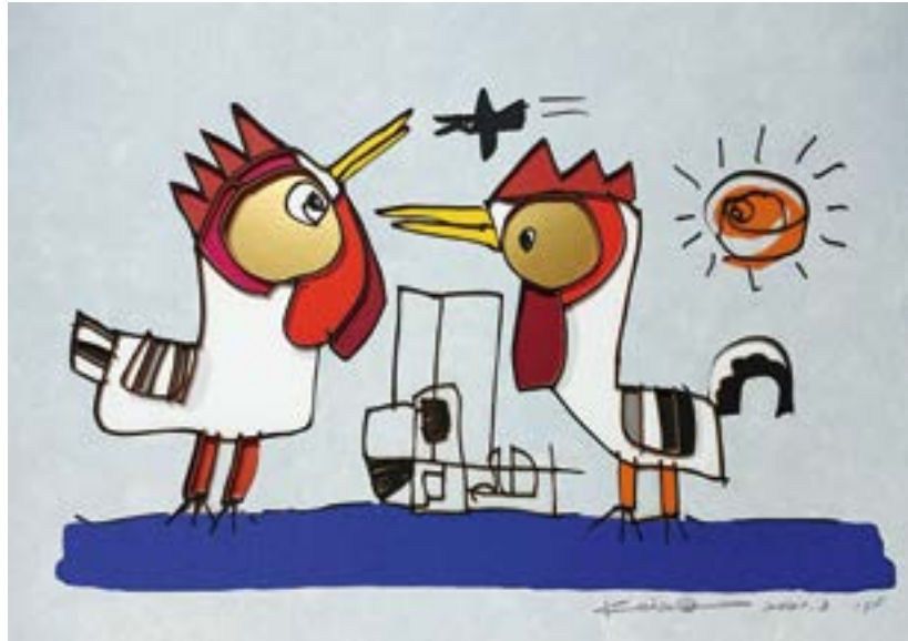
オレンジの時 210 mm × 297 mm