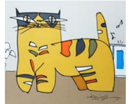
この音 ウキウキするの！ 200 mm × 230 mm