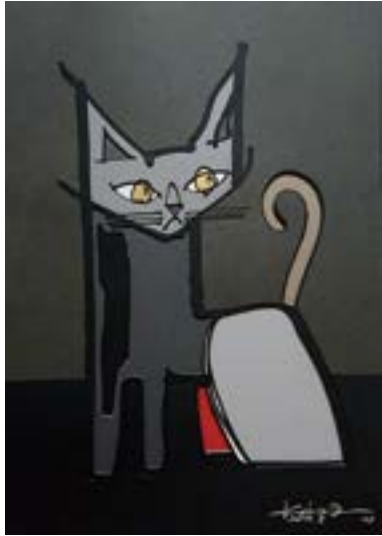
黒い貴公子 297 mm × 210 mm