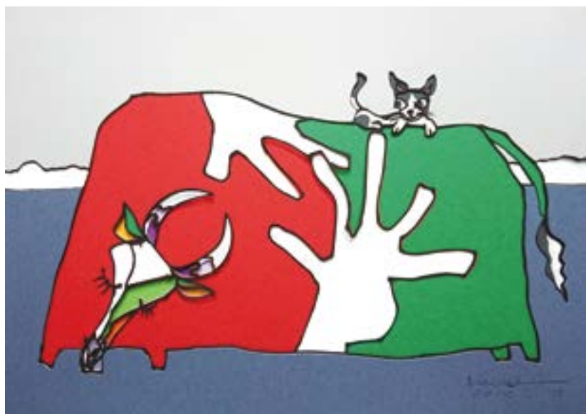
幼なじみ 210 mm× 297 mm