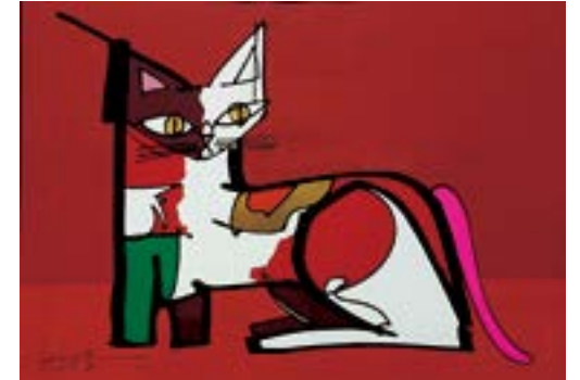
ワタシ、知らないモン 210 mm × 297 mm