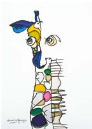
新星 297 mm× 210 mm