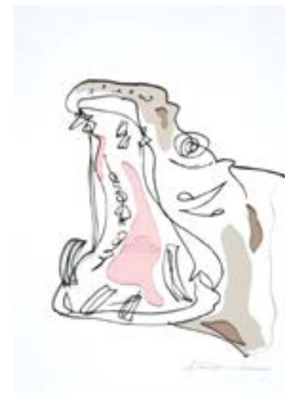
口は目よりも物を言う 297mm×210mm