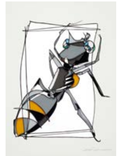
コンダクター 297 mm × 210 mm