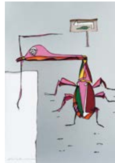
葉っぱ、探さなきゃ 297 mm × 210 mm